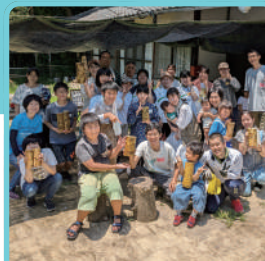
オルタナティブスクール 竹林のスコレー