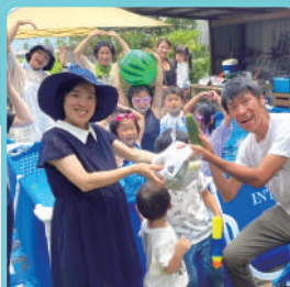
妊婦さんへのお野菜プレゼント

無農薬・無化学肥料で育てた野菜を地域の妊婦さんに贈る活動を展開しています。また、自然豊かな環境で子供たちが、体験を通じて学ぶオルタナティブスクール「竹林のスコレー」を運営しています。新しい命の誕生の祝福と、子どもたちが自然の中で遊び学ぶ「子供の楽園」を目指しています。