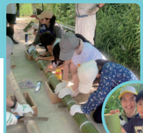
以前実施した 竹灯籠WSの様子