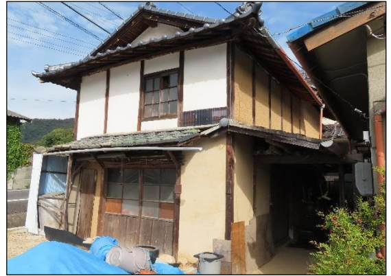
物置・農機具倉庫