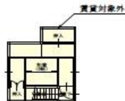
2階 平面図 S:1/150