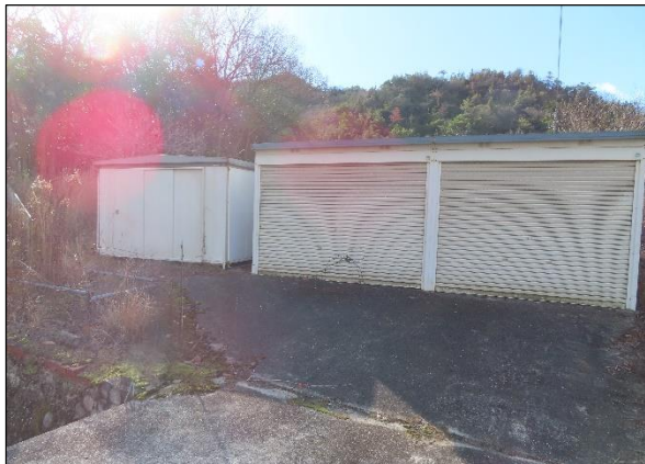
物置・農機具倉庫