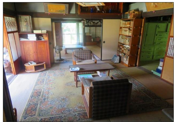
和 室 ①